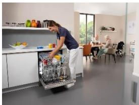
Foto 1: Mit hohen Spül- und Nachspültemperaturen sorgen Frischwasserspülmaschinen der Serie MasterLine von Miele für beste Hygienebedingungen – auch in Senioreneinrichtungen. Für Medikamentenbecher und Schnabeltassen stehen Spezialeinsätze zur Verfügung.